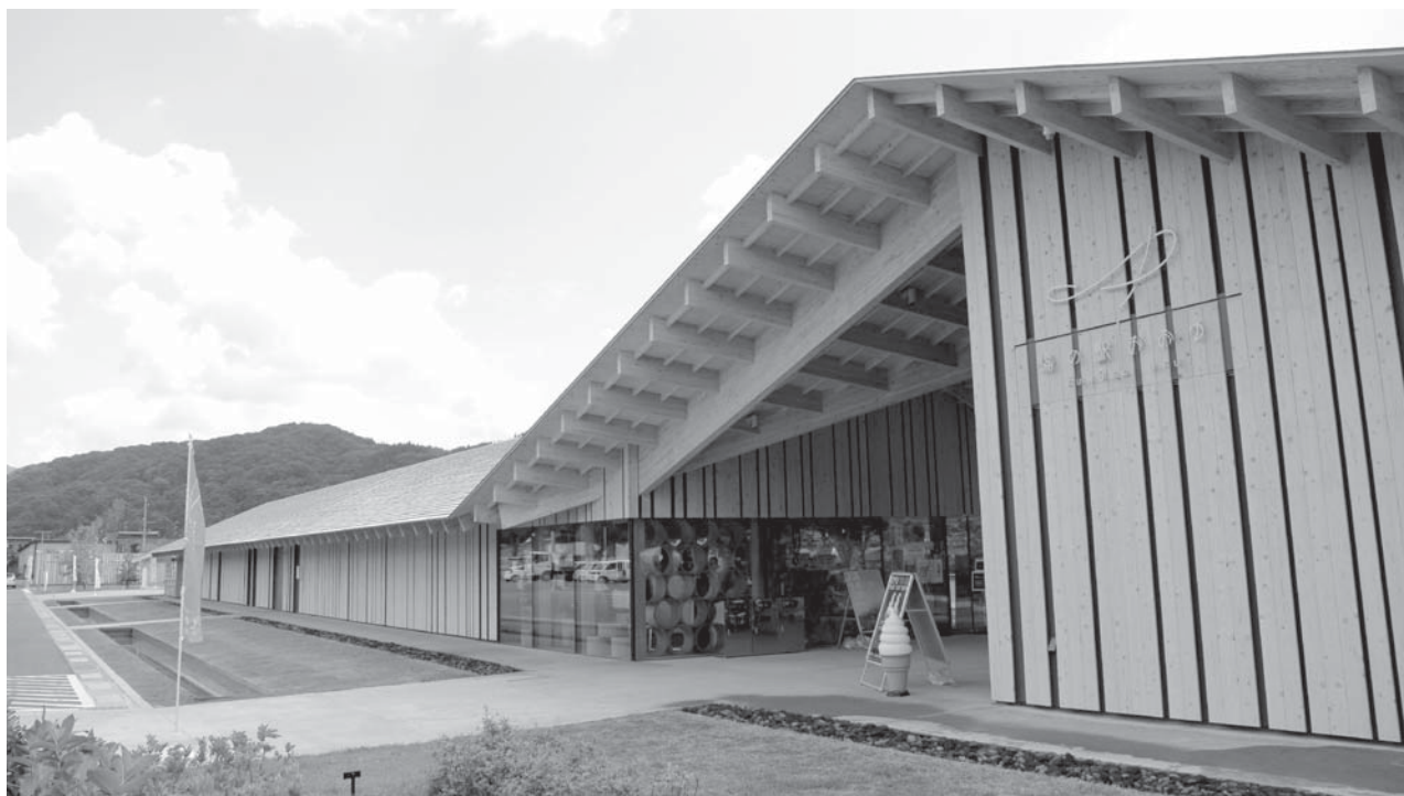
(道の駅おおゆ入口)

世界的建築家である隈研吾氏が大湯を訪れ、優しい山々と、美しい川がゆっくりと流れる景色を見て、『縁側』のイメージが浮かび、設計した道の駅です。