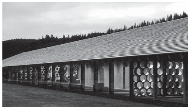
(夕日をバックに正面外観)