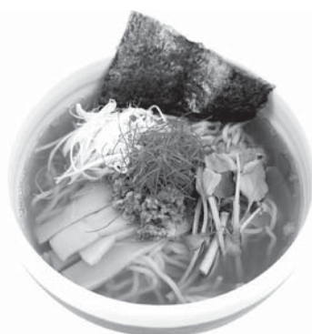
(かづの牛だしスープ麺)

受賞した「かづの牛だしスープ麺」や、かづの短角牛バーガー、濃厚なのにあと味さっぱりな秋田県産乳使用のミルクソフトクリームも人気です。是非一度ご賞味ください。