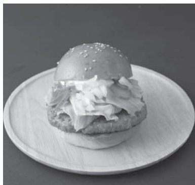
(かづの短角牛バーガー)