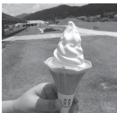
(ミルクソフトクリーム)