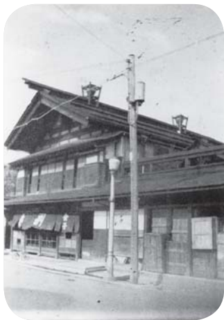
(「金子家住宅」と「天水甕」) - 昭和15年頃 -

私は昭和44年10月生まれ、昭和63年3月に高校を卒業し、大学進学の為上京するまで18年間この家に住んでいた。